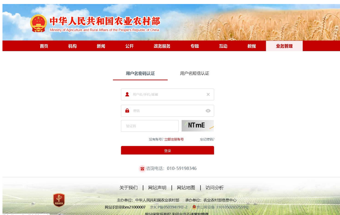
图 1-1 系统登录页